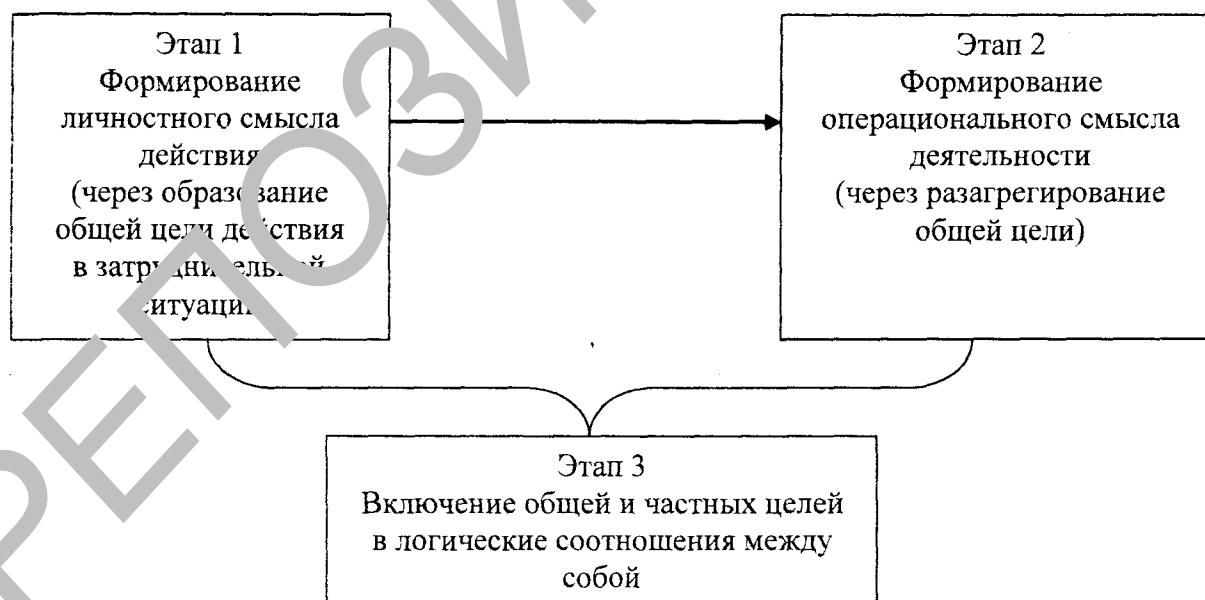
Рис. 2. Схема формирования механизмов целеобразования, входящего в функциональную структуру переживания затруднительных ситуаций

Логика формирования механизмов целеобразования в структуре переживания затруднительных ситуаций обусловлена, с одной стороны, логикой