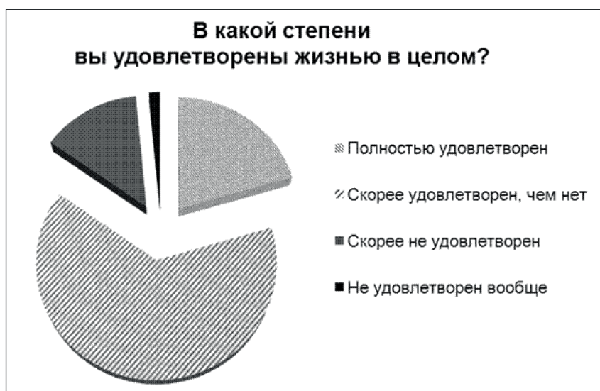
Рисунок 2. – Удовлетворенность жизнью студентов

На фоне интегральной жизненной удовлетворенности более позитивными выглядят оценки удовлетворенности собственной личностью. Так, на вопрос «Удовлетворены ли вы собой?» каждый четвертый однозначно ответил, что удовлетворен; 68,5 % в целом удовлетворены, но стремятся к дальнейшему саморазвитию и считают, что нужно поднатужиться; 6 % не довольны собой и менее 1 % считают себя неудачниками по жизни (рисунок 3).