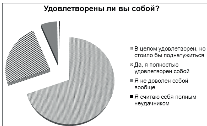
Рисунок 3. – Удовлетворенность самим собой