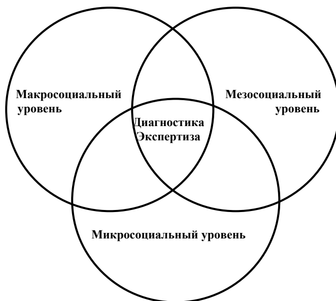
Рисунок 3. – Междисциплинарный кластер образовательной стратегии