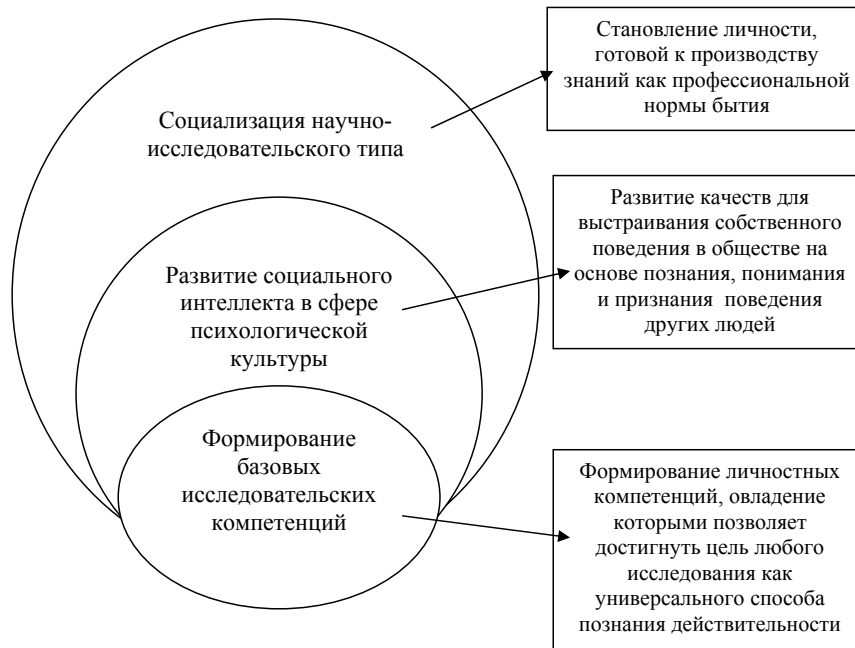
Рисунок 1. – Образовательная стратегия социокультурного развития профессионала