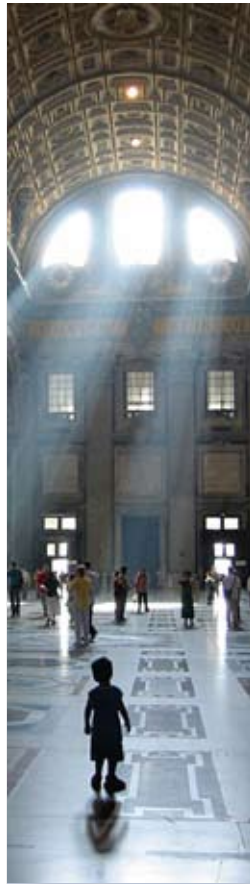
В соборе Святого Петра в Риме

Во-первых, в условиях глобализации общество не смогло выработать солидарной ответственности за происходящее, оставаясь во власти локального мышления. Возникло противоречие между глобальностью материального взлета и ограниченностью реально функционирующего сознания, углубилась конфронтация между обществом и