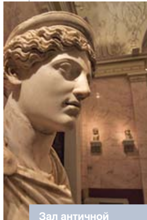
Зал античной скульптуры в Эрмитаже в Санкт-Петербурге

В традиционном для культурологии ключе в соответствующем подразделе книги решается вопрос о возрожденческом восприятии культуры. Отмечается, что одним из фундаментальных представлений идеологии эпохи Ренессанса является гуманизм, утверждающий главным действующим