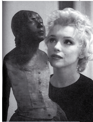
Мэрилин Монро на выставке работ Эдгара Дега. Лос-Анджелес, 1956 год

Она в большей степени ориентирована на обустройство земной жизни и в меньшей степени ощущает значимость связи с космосом. Автор пособия приходит к выводу: «В реальной жизни человечеству еще предстоит выстрадать понимание того, что поиск гармонии, основанный на недоверии к совершенству Целого, культе борьбы, научных знаний, техники, стремлении к тотальному равенству, нивелировке личности, жесткой регламентации всех сторон социального бытия, линейном мышлении, забвении глубины микрокосма, неизбежно