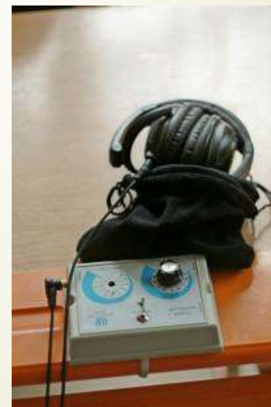
Гукаўзмацняльная апаратура калектыўнага карыстання УНІТОН-М