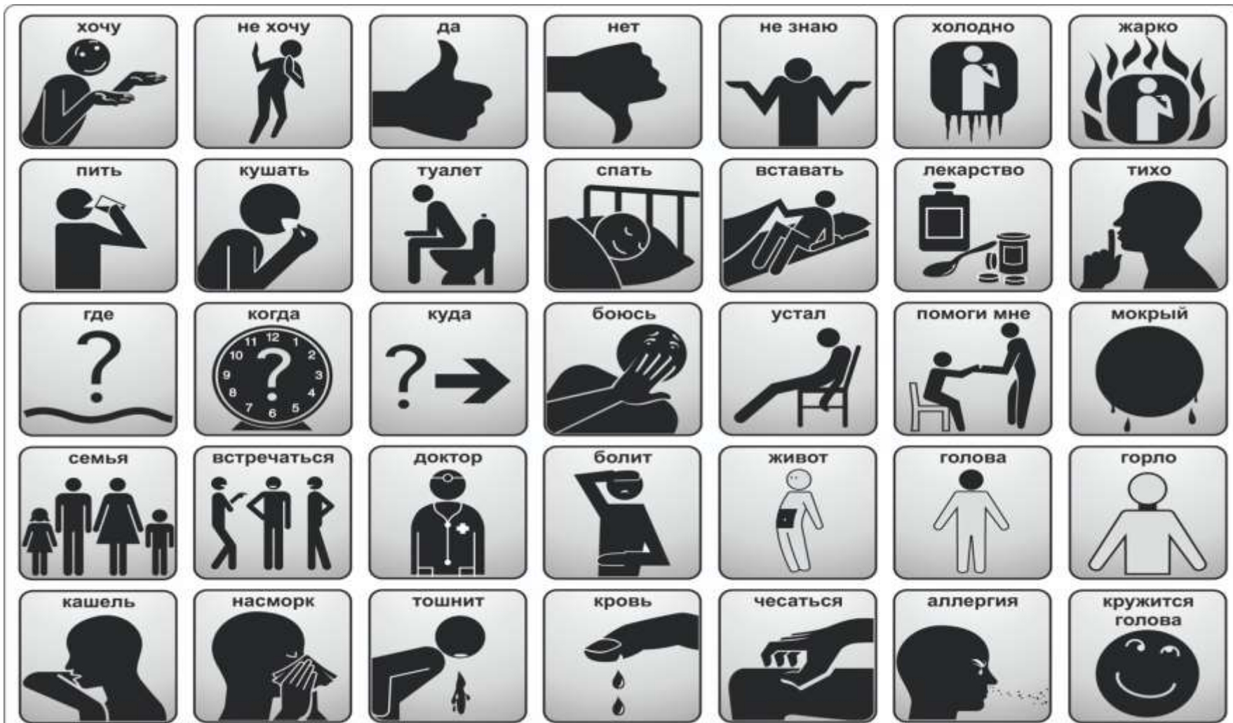
Карта общения пациента с нарушением речевой функции. http://understandme.su