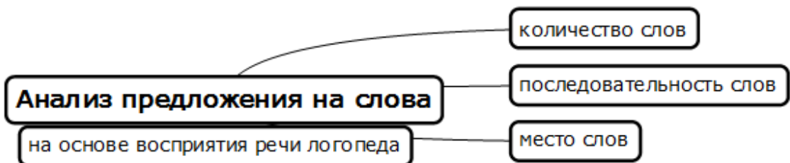
Рисунок 3 - Компоненты синтаксического уровня языкового анализа и синтеза