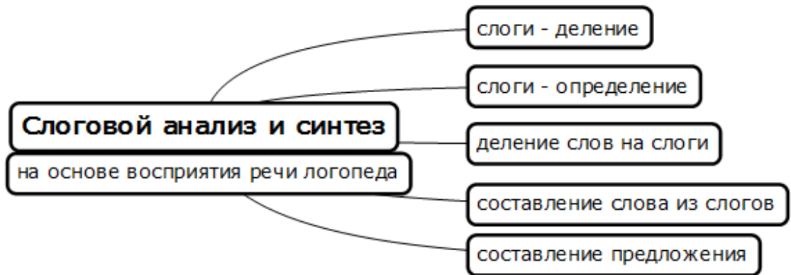
Рисунок 2 - Компоненты слогового уровня языкового анализа и синтеза