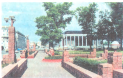
Парапеты вакол Цэнтральнага сквера ў Мінску. 1999.

ПАРАПЭТ (франц. parapet ад італьян. parapetto ад parapete абараняць + petto грудзі), невысокая сцэльная сцена, якая агароджае пакрыўце будынка, тэрасу, балкон, набярэжную, мост і інш. Часта бывае пастаментам для дэкар. ваз і статуі. Вядомы са старажытнасці ў архітэктуры Грэцыі і Рыма. Найб. шырока выкарыстоўваўся ў архітэктуры стыляў рэнесансу, барока і класіцызму. У выглядзе П. робяць парадныя агароджы