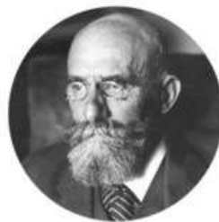
КРИСТИАН ФОН ЭРЕНФЕЛЬС