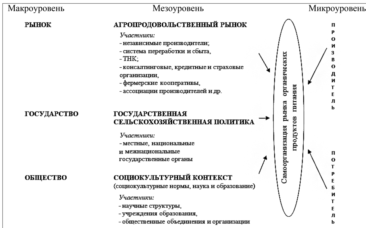
Рисунок 1 – Механизм институционализации рынка органической продукции

На мезоуровне происходит оформление рамочных норм поведения, определяемых сферами рыночного взаимодействия, государственной политикой и социальным взаимодействием. Здесь необходимо отдельно выделить роль в современных условиях транснациональных корпораций в формировании отношений по поводу воспроизводства аграрного капитала на глобальном уровне.