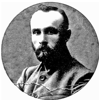
Іларыён Пузыроў [9]

Пасля пераезду ў Вільню фактычны кіраўнік НКАЗ ЛітБел І. Пузыроў рашуча праводзіў лінію на нацыяналізацыю медыцынскіх рэсурсаў, перш за ўсё лекавых сродкаў, што было ў значнай ступені выканана на беларускіх землях і ў меншай – у Літве [17, арк. 18 адв.]. Аднак першапачатковая нацыяналізацыя лекаў была прадыхавана не толькі бальшавіцкай палітыкай, але і надзённай неабходнасцю – падчас баявых дзеянняў беларускія і літоўскія землі сутыкнуліся з моцнай хваляй інфекцыйных хвароб, што ўскладнялі і без гэтага адчайнае становішча новай рэспублікі, якую крок за крокам захоплівалі польскія войскі. У мэтах барацьбы з інфекцыямі 2 красавіка 1919 г. СНК ЛітБел прыняў рашэнне аб пабудове сеткі грамадскіх лазняў і арганізацыі санітарных атрадаў, на што было вылучана 500 тыс. руб. [11, с. 61].