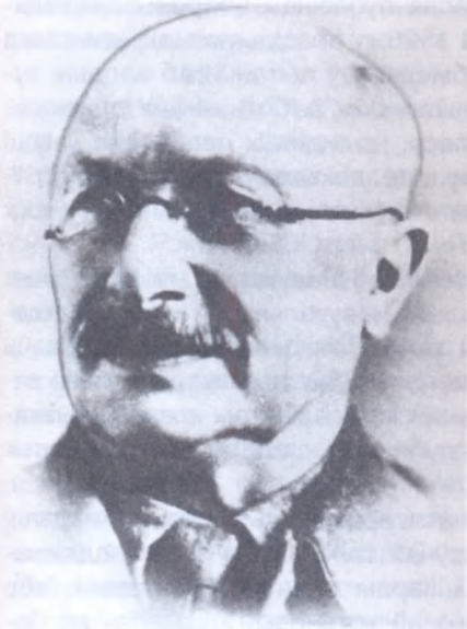
Заслужаны дзеяч навукі БССР, першы доктар медыцынскіх навук Я. Корчыц.