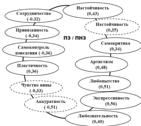
Рис. 1. Корреляции полнезависимости и черт личности

( r=0,51, p < 0,01 ) и с двумя вторичными факторами «Большой пятерки»: F2 «Привязанность – обособленность» ( r=-0,34 ) и F5 «Экспрессивность – практичность» ( r=0,56, p < 0,01 ). При этом необходимо принимать во внимание наличие обратно пропорциональных корреляций, то есть эти черты соответствуют полнезависимым респондентам, напротив, для полнезависимых студентов скорее характерны следующие черты личности: соперничество, импульсивность поведения и обособленность. При выполнении второй методики, предусматривающей выполнение заданий при условии избытка информации, полнезависимость коррелирует с настойчивостью ( r=0,35 , не знач.) и любознательностью ( r=0,40, p < 0,05 ); полнезависимость – с чувством вины ( r=-0,33 ) и аккуратностью ( r=-0,51, p < 0,01 ). Следовательно, когнитивный стиль имеет ситуационное преимущество и не предполагает оценочных суждений.