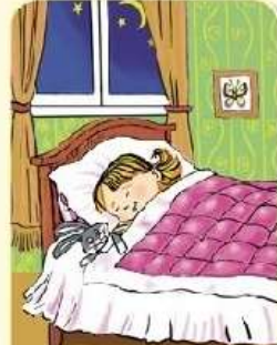
Сон — в 21.00 — 21.30.

В.В.Далівеля, загадчык кафедры педагогікі і псіхалогіі інклюзіўнай адукацыі