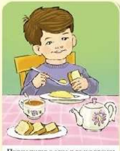
Прием пищи в одно и то же время: завтрак — в 9.00, обед — в 13.00, ужин — в 19.00.