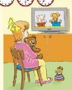
Просмотр детских телепередач.