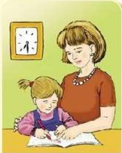
Занятия с родителями — с 18.30 до 19.00.