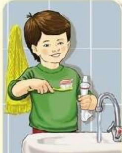
Подготовка ко сну — в 20.30.