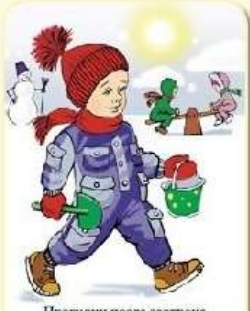
Прогулки после завтрака (с 10.00 до 12.00) и полдника (с 16.30 до 18.30).