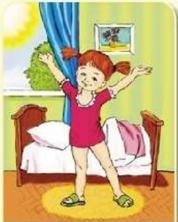
Пад'ём, утренняя гимнастика — в 7.30.