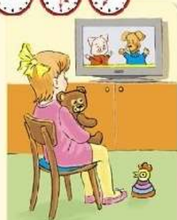
Просмотр детских телепередач.