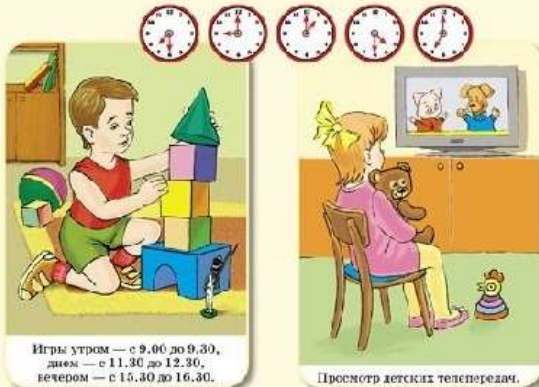
Игры утром — с 9.00 до 9.30, днем — с 11.30 до 12.30, вечером — с 15.30 до 16.30.