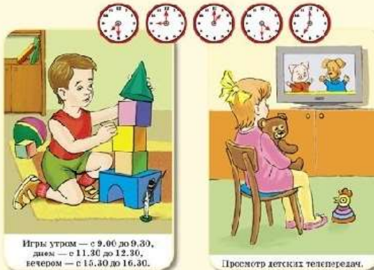
Игры утром — с 9.00 до 9.30, днем — с 11.30 до 12.30, вечером — с 15.30 до 16.30.