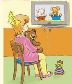
Просмотр детских телепередач.