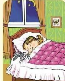
Сон — в 21.00 — 21.30.