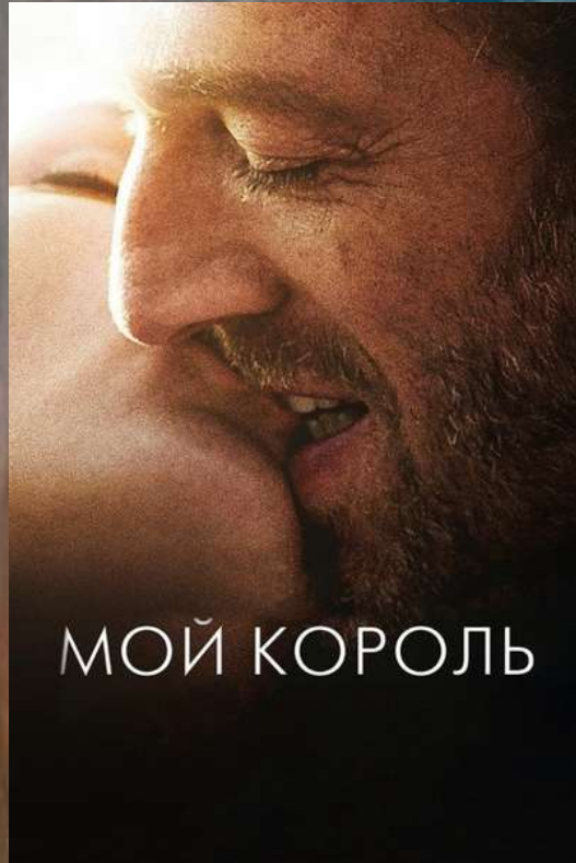
«Мой король», 2015 год, Франция, режиссер Майвенн