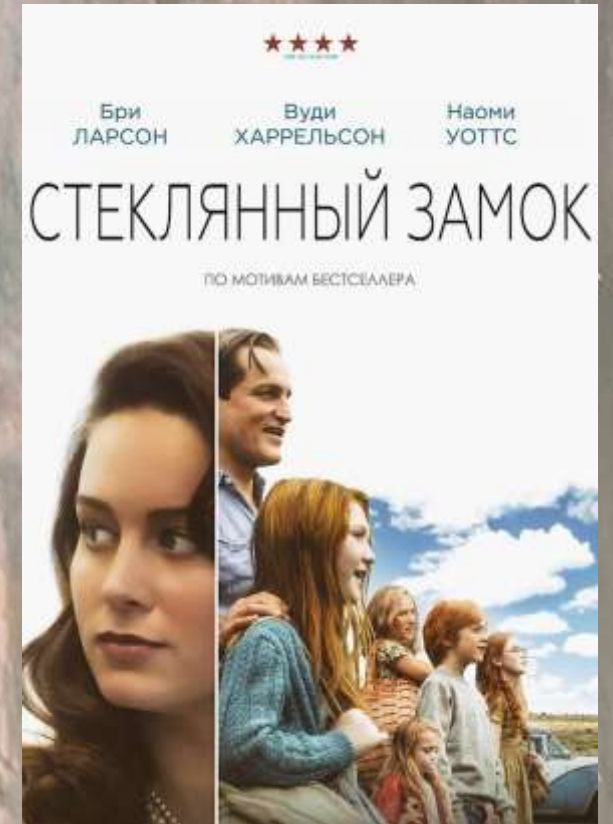
«Стеклянный замок», 2017 год, США, режиссер Дестин Креттон