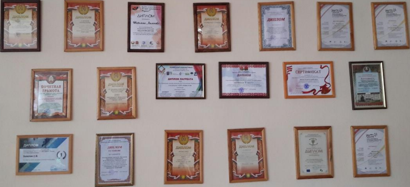
Совместная исследовательская деятельность: награды