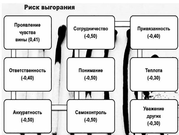
Рисунок 3 – Показатели корреляционного анализа переменных риска выгорания и черт личности большой пятерки

Корреляционный анализ позволяет определить общие черты будущих специалистов с риском усталости от сострадания и риском выгорания и отличия между ними. Их объединяет отсутствие навыков понимания и уважения других людей, неаккуратность, импульсивность и безответственность, склонность к соперничеству при разрешении конфликтов. В то же время респондентов с риском усталости от сострадания отличает обособленность (замкнутость), депрессивность и излишняя реалистичность. Напротив, студенты с риском выгорания характеризуются как проявляющие чувство вины и пассивность (на уровне статистической значимости).