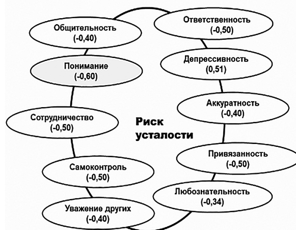
Рисунок 2 – Показатели корреляционного анализа переменных риска усталости от сострадания и черт личности большой пятерки

Другими словами, риск усталости от сострадания взаимосвязан с наличием таких черт личности, как замкнутость, непонимание других и центрация на себе, безответственность и неаккуратность, излишняя реалистичность поведения и импульсивность, а также склонность к соперничеству.