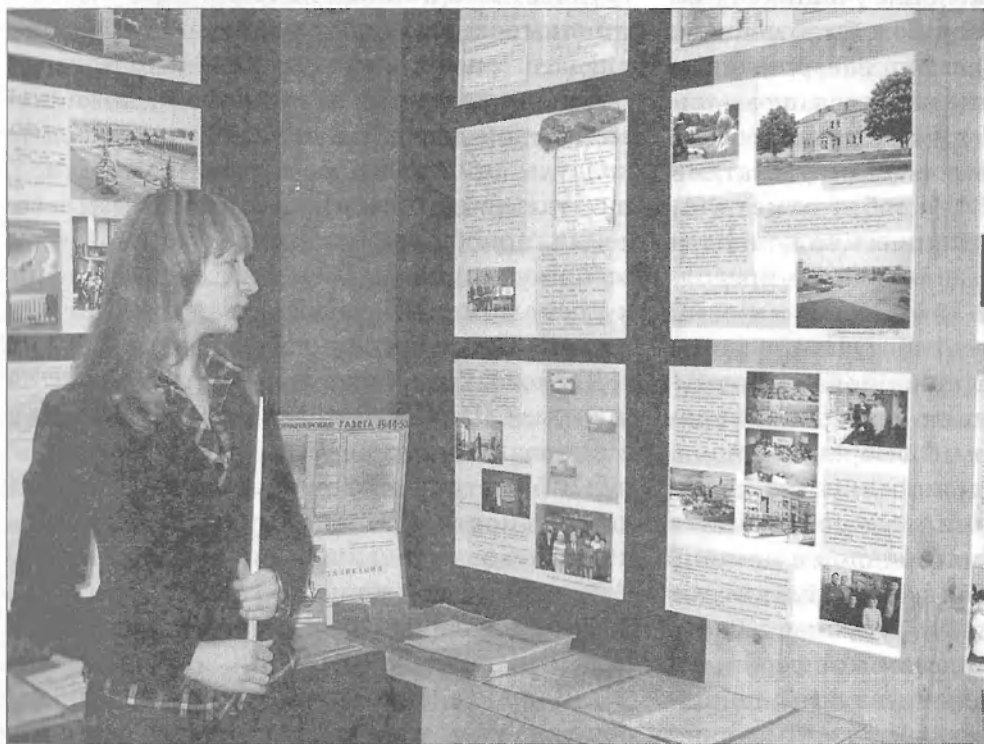
В музее Вороновской СШ

Непосредственными участниками инновационной работы стали детские и молодёжные организации школы. По их