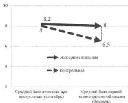
Рис. 3. Сравнение успеваемости первокурсников контрольной и экспериментальной групп на контрольном этапе эксперимента (на основании оценки медиан)

В частности, для КГ Z = -9,467 , \alpha = 0,000 , что меньше заданной критической 0,05 ; оценки медиан за сентябрь и февраль – 55 и 61 соответственно, здесь тоже наблюдается рост в среднем на 6 пунктов.