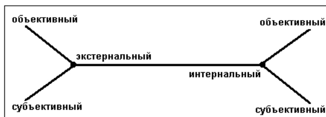
Рис. 3. Соотношение факторов, влияющих на эффективность внедрения самостоятельной работы

Модель представляет собой систему координат, включающую два континуума: экстернальный – интернальный и объективный – субъективный. Для большей наглядности ее можно «развернуть» в конструктор Дж. Келли – М.А. Холодной (рис. 3).