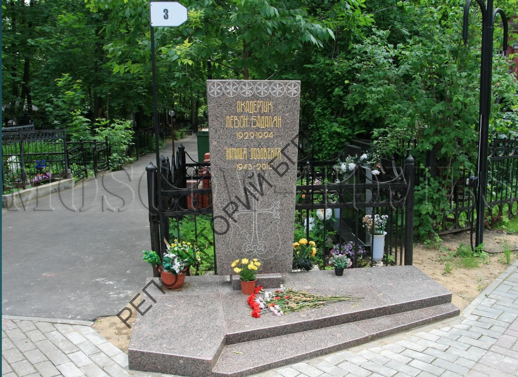
Магіла Л.О.Бадаляна на Армянскіх Ваганькаўскіх могілках (Масква)