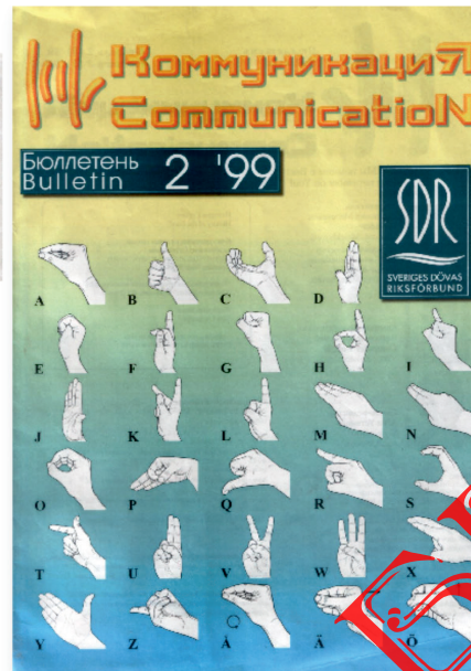
Фотодокумент обложки бюллетеня «Коммуникация» (1999 г.)

Важное место в деятельности ЦП БелОГ занимала проблема трудоустройства глухих. Так, в 1991–1996 г. был трудоустроен 1081 инвалид по слуху, в том числе на учебно-производственные предприятия БелОГ – 775 чел. К трудовой деятельности было приобщено 6500 чел., из которых на УПП БелОГ трудились 2345 чел., на государственных предприятиях и в организациях – 3486, в сельском хозяйстве – 452, коммерческой деятельностью занимались 217 чел. Вместе с тем за данный пятилетний период общее количество работающих уменьшилось на 1949 чел. [4, л. 159], что явилось следствием сокращения глухих с обслуживающими переводчиками-дактилологами (переводчики жестового языка) на государственных предприятиях. Например, если в 1994 г. на них работало 1833 глухих, то на 1 января 1999 г. 1564 чел. Основной контингент глухих на производстве сократился за счет ухода на пенсию по возрасту, а также эмиграции за пределы Республики Беларусь и др. Особенно актуальным являлся вопрос трудоустройства инвалидов по слуху в малых городах, где отсутствовали крупные предприятия и намечился рост безработицы [4, л. 159]. В отличие от государственных предприятий, в новых экономических условиях УПП и социально-культурные учреждения БелОГ сохранили рабочие места, где трудились инвалиды по слуху, и тем самым обеспечили социальные гарантии и не допустили роста численности безработных.