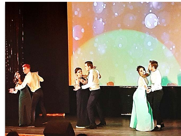
Конкурс профессионализма и красоты «Медиадива»