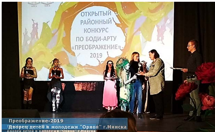
Открытый районный конкурс по боди-арту «Преображение»