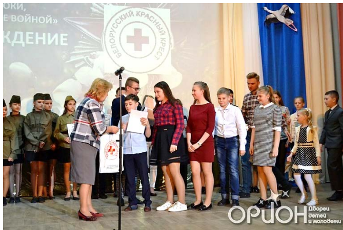
Районный литературный конкурс «Строки, опаленные войной»