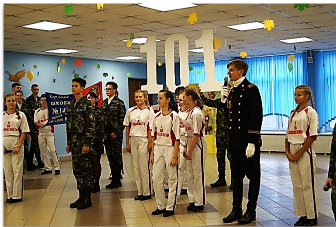
Осенний бал юных спасателей-пожарных