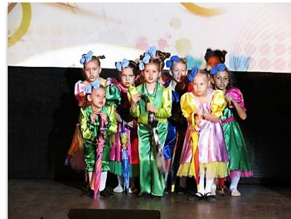
Конкурс детского творчества для начинающих «Орион.Творчество.Мы»