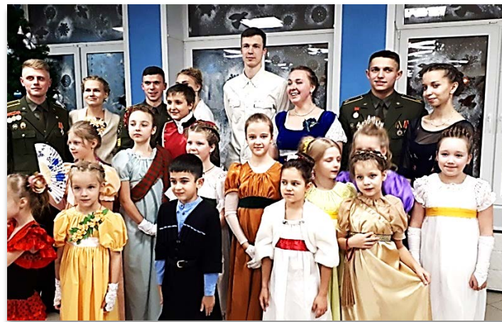
Рождественский бал «Дыхание времени. Блистательный XIX век»