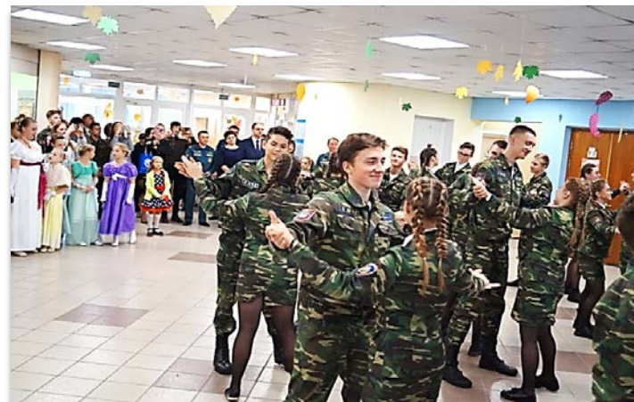
Осенний бал юных спасателей-пожарных