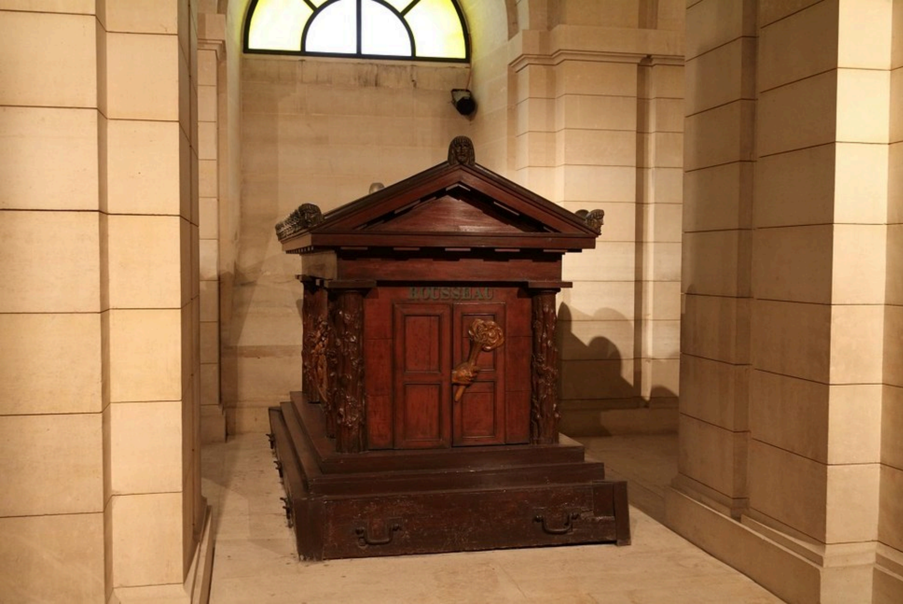
Надгробие Руссо в парижском Пантеоне.