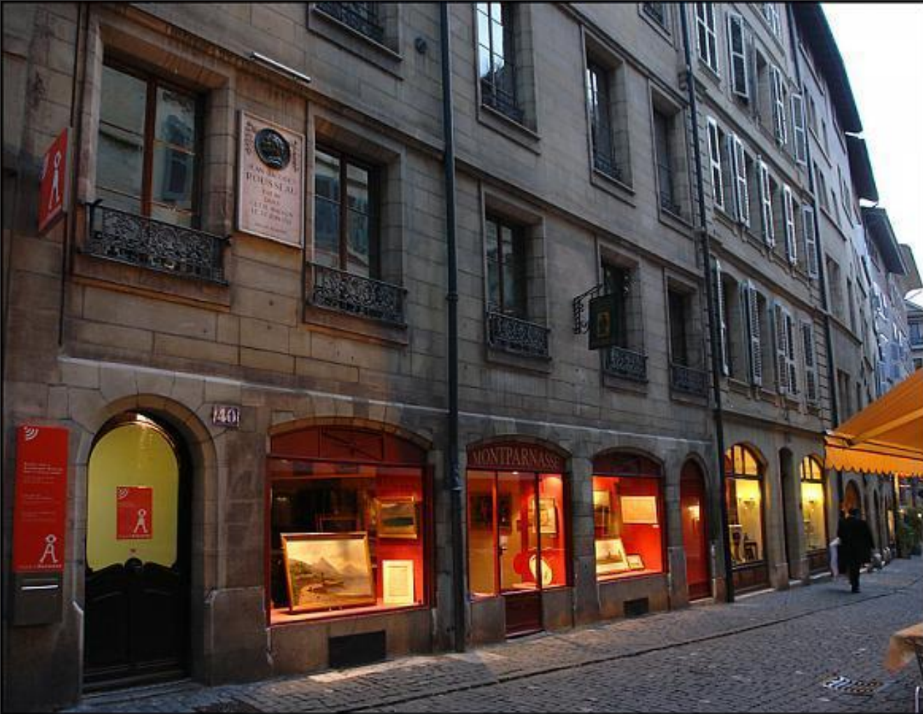
Дом, где родился Руссо