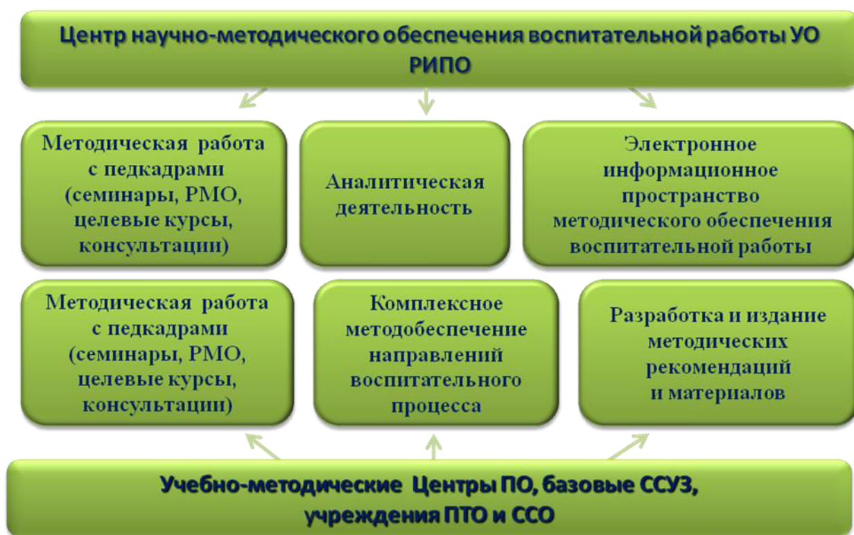
Рис. 1. Система научно-методического обеспечения воспитательной работы.

Центром научно-методического обеспечения воспитательной работы (ЦВР) сформирована система научно-методического обеспечения, позволяющая формировать структуру и содержание воспитательного процесса в учреждениях профессионального образования (рис. 1).