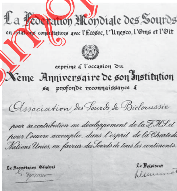
Фотоматериал Почетного диплома Всемирной федерации глухих (1961 г.) из фондов бывшего музея БелОГ