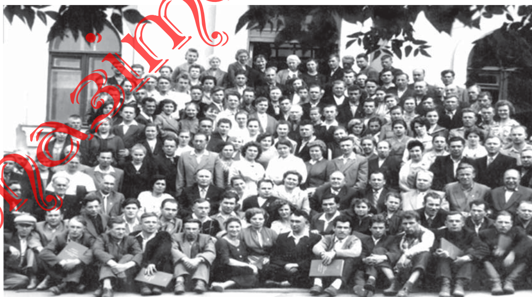
Фотоматериал делегатов и гостей VII съезда БелОГ возле Минского клуба глухих, находившегося на ул. Мясникова, 27 (август, 1960 г.)

В связи с переходом учреждений культуры и учебно-производственных предприятий БелОГ на полный хозяйственный расчет и самофинансирование структура ЦП существенно изменилась в 1989 г. Центральное правление включало руководство (председатель и заместители), отдел технического прогресса и строительства, плано-экономический отдел, отдел труда и заработной платы, отдел оргмассовой работы и кадров, отдел материально-технического снабжения и сбыта, центральную бухгалтерию и хозяйственную часть [3, л. 128].