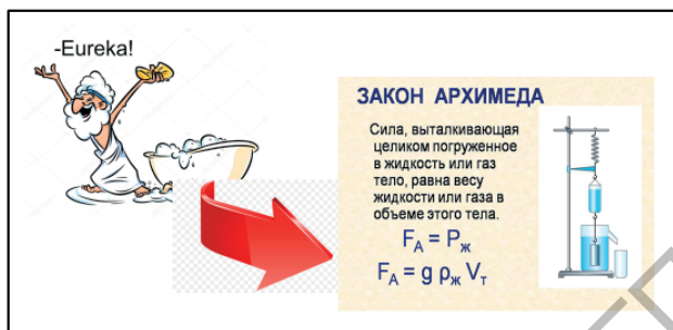
Рис. 1. Открытие основного закона гидростатики

поле) теории креативности М. Csikszentmihalyi, системе эвристического обучения А. Д. Короля [5] и теории дуального мышления Д. Канемана.