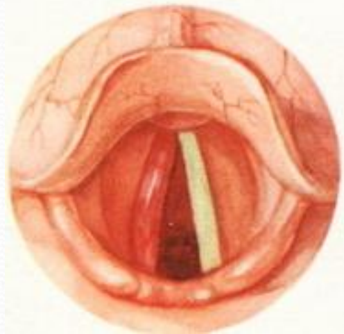
Малюнак 1. Аднабаковае пачырваненне галасавой звязкі