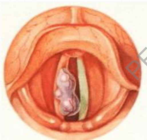
Малюнок 4. Паліп галасавой звязкі