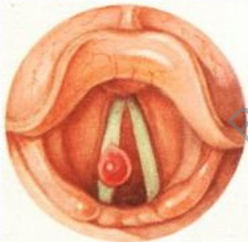
Малюнак 2. Фіброма галасавой звязкі