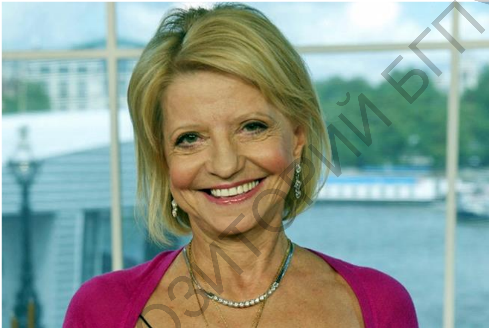
○ Ольга Корбут в 2017г.