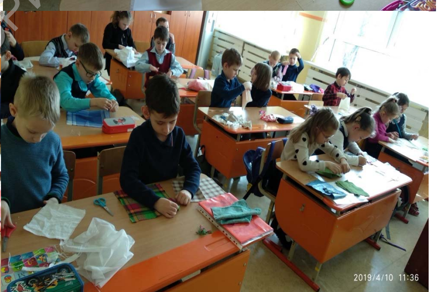
Формирование коммуникативных умений у учащихся с нарушением слуха, компенсированным кохлеарным имплантом, на уроках трудового обучения