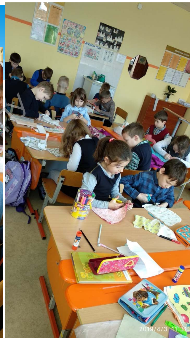
Формирование коммуникативных умений у учащихся с нарушением слуха, компенсированным кохлеарным имплантом, на уроках трудового обучения