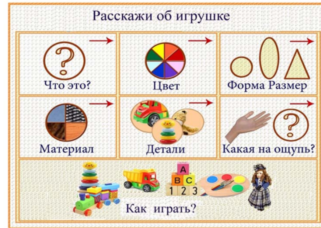
Рисунок 2.5. - Методика «Составь описательный рассказ»