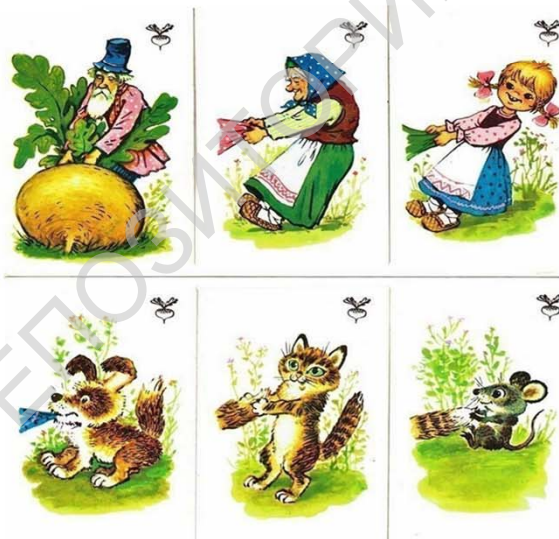
Рисунок 2.3. - Методика «Перескажи сказку»