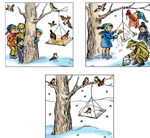
Рисунок 2.4. - Методика «Составь рассказ по картинкам»