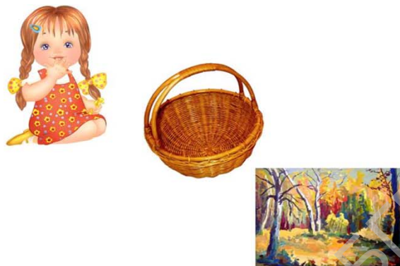
Рисунок 2.2. - Методика «Закончи фразу»