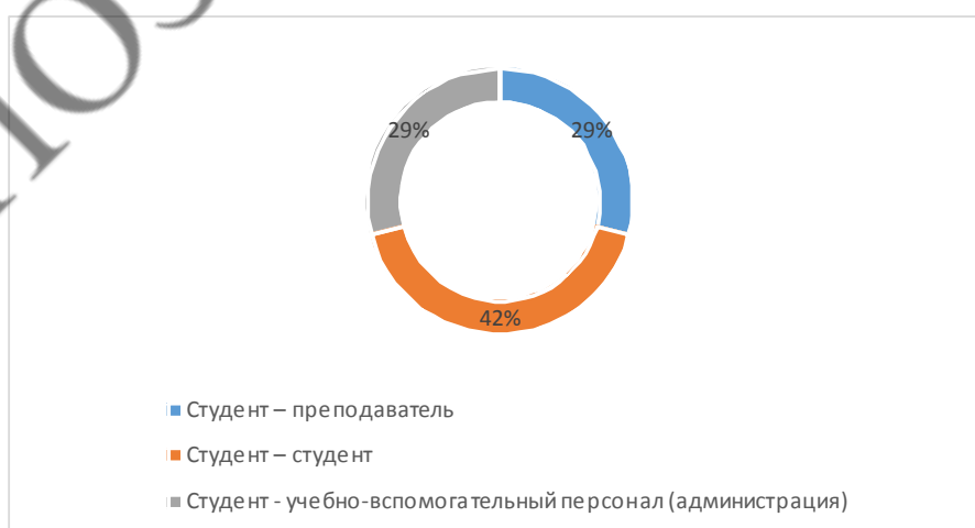
Рис. 1.1 Виды конфликтов, встречающиеся наиболее часто

Например, на вопрос «Какие конфликты, на Ваш взгляд, чаще встречаются в студенческой среде?» (с возможностью выбрать несколько вариантов), ответы распределились следующим образом (Рис. 1.1):