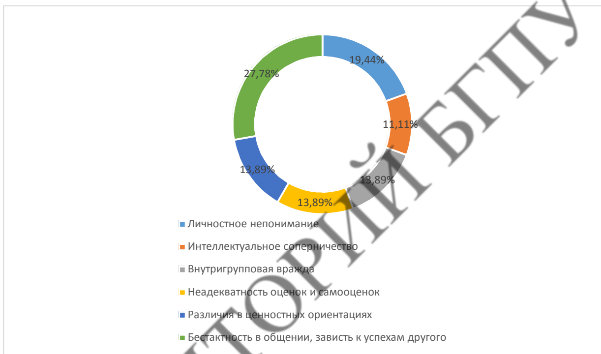
Рис. 1.2 Причины конфликтов в диаде студент – студент

В вопросе «Каковы, на Ваш взгляд, наиболее значимые причины возникновения конфликтов в диаде студент – студент?» (с возможностью выбрать несколько вариантов), ответы распределились следующим образом (Рис. 1.2):