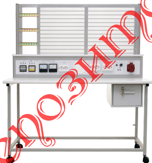
Рисунок 1 – Внешний вид базового стенда НТЦ-08.47.1 «Электромонтажный комплекс»

Для описанной проблемы были проанализированы известные ранее лабораторные работы [5–6] и на базе универсального электромонтажного комплекса НТЦ-08.47.1 «Электромонтажный комплекс» [7] (рисунок 1) была разработана лабораторная работа «Электрические свойства проводников и полупроводниковых приборов».