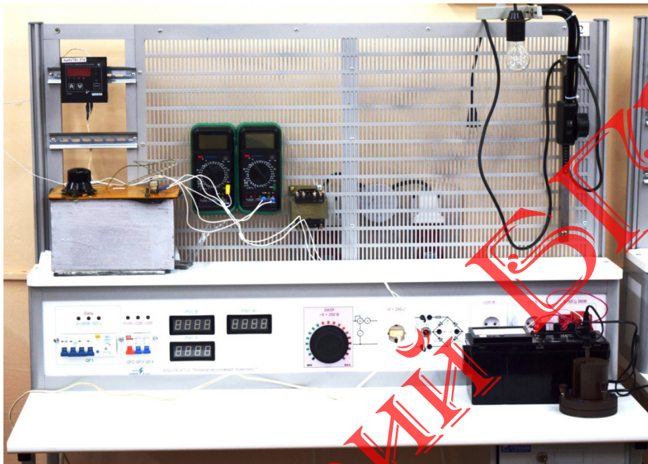
Рисунок 3 – Внешний вид доработанного лабораторного стенда с оснащением для проведения работы «Электрические свойства проводниковых и полупроводниковых материалов»

стат 3, заполненный трансформаторным маслом 4. Трансформаторное масло нагревается с помощью электронагревателя 5, который питается от регулируемого источника переменного тока (автотрансформатора), что позволяет регулировать скорость нагрева.