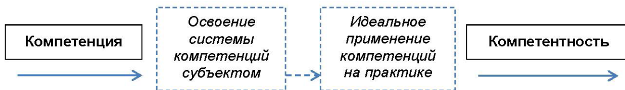
Рисунок 3 – Соотношение понятий «компетенция» и «компетентность» по Н. Хомскому

Н. Хомского, «компетенцию» можно рассматривать как некую версию идеального объекта, который не присутствует в реальности, но удобен для изучения и понимания. По мнению Н. Хомского, «компетенции» представляют собой знания (в широком смысле этого слова), которые преобразовываются в «компетентность» в ситуациях их применения на практике (рисунок 3) [3; 8].