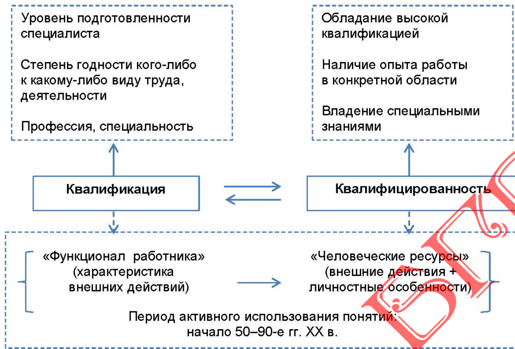
Рисунок 1 – Сущность понятий «квалификация» и «квалифицированность»