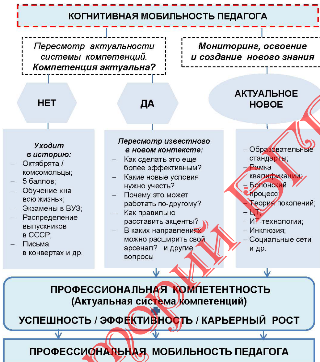
Рисунок 6 – Когнитивная мобильность педагога как механизм адаптации компетенций к изменяющимся условиям образовательной среды

Прокомментируем данную схему на примере собственного исследования («Развитие когнитивной мобильности педагога в процессе дополнительного образования взрослых», 2009–2014 гг.).