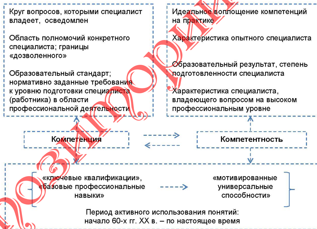
Рисунок 2 – Сущность понятий «компетенция» и «компетентность»

Так, понятия профессиональная «квалификация / квалифицированность» и «компетенция / компетентность» являются рабочими и взаимодополняющими, их значение постоянно расширяется в соответствии с новым контекстом компетентностного подхода в образовании и формированием единых международных требований к компетенциям (ICB – International Competence Baseline).