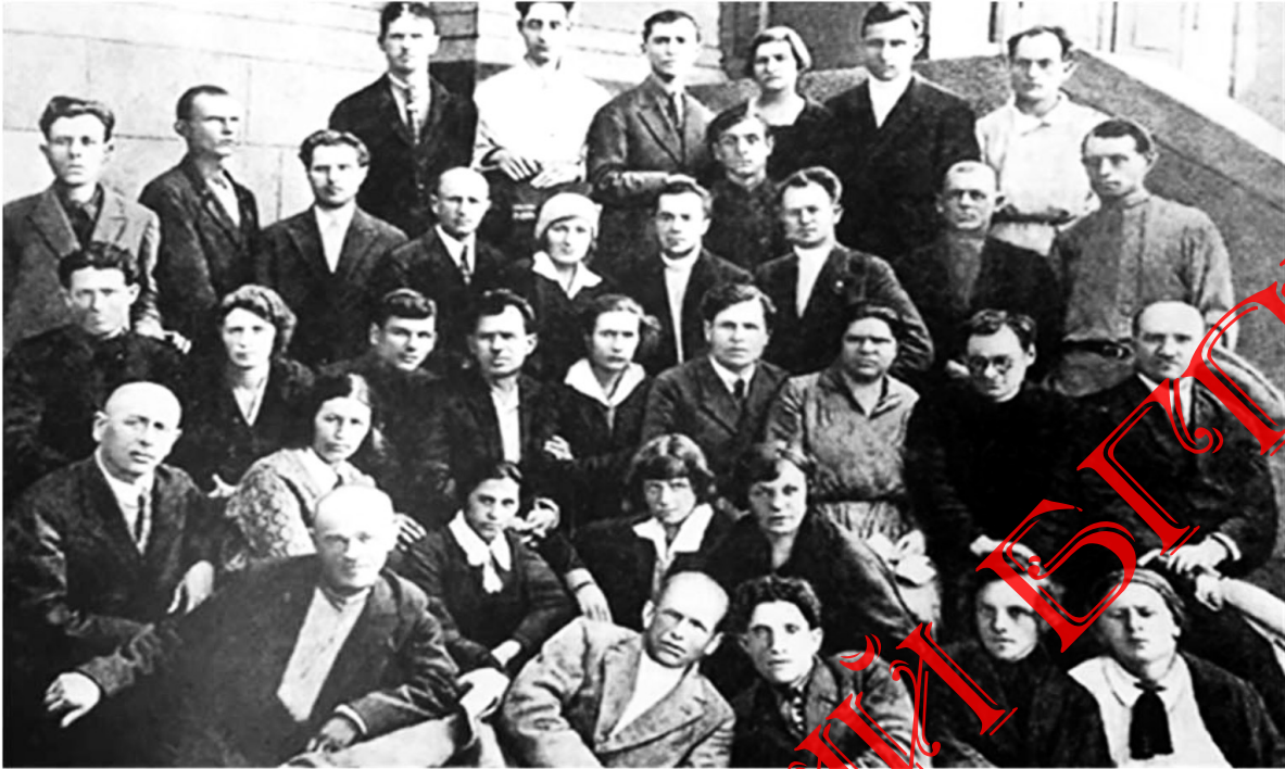
Фотоматериал делегатов и гостей I Всебелорусского объединения глухонемых (1932 г.) из фондов бывшего музея БелОГ