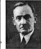
Янка Купала (1882-1942)

«Першае чытанне для дзетак беларусаў» и «Букварь» вошли в число первых белорусских учебников. Книжки Тётки во многом предопределили развитие национальной учебной и детской литературы. Они проникнуты идеями народности, направлены на воспитание детей на положительных, примерах из труда и быта крестьянина, подчёркивают его трудолюбие. Произведения Тётки учили детей тонко чувствовать родную природу. В 1914 Тётка редактировала юношеский краеведческий иллюстрированный журнал «Лучинка» (1914 г., вышло 6 номеров), широко освещавший вопросы обучения и воспитания молодёжи. В своих публицистических статьях («Как нам учиться», «Берегите родное слово» и др.) Тётка выступила как пропагандист демократических взглядов на проблемы народного просвещения.