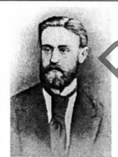
Янка Лучина (1851-1897)

В своих произведениях, правдиво показывал угнетенное положение белорусского народа, выражал их ненависть к самодержавию и стремление к свободе. Лирическое стихотворение на белорусском языке являются основным жанром его творчества. В них отражается любовь к крестьянству, стремление видеть его образованным и счастливым. Стихи Я. Лучины были посмертно собраны в сборнике «Вязанка», вышедшем в 1903 году.