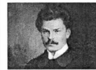
Максим Богданович (1891-1917)

Книга Я. Коласа «Другое чытанне для дзетак беларусаў» была настоящим событием времени. Как писатель и педагог, который хорошо знает психологию детей, он составил учебную книгу таким образом, что она прекрасно формировала культурные и природоведческие представления воспитанников. Первые четыре раздела данной книги посвящены природе, а именно временам года. А в последних трех разделах размещены произведения и примеры народного творчества. Белорусская литература, фольклор и родная природа, по мнению Я. Коласа являются важными факторами средствами воспитания и обучения ребенка. Я. Колас не только рекомендовал, как прививать детям любовь к труду и родной природе, но и сам стремился добиться этого своими замечательными произведениями о красоте белорусской природы, написанными для детей.