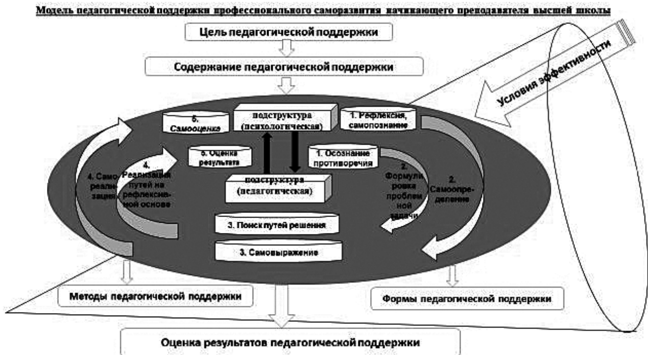
Рисунок 1 – Модель педагогической поддержки профессионального саморазвития начинающего преподавателя высшей школы

Ключевой идеей методики является цикличность в построении педагогической поддержки вокруг решения конкретного затруднения. Это затруднение объективируется в проблемной задаче, а затем осуществляется поиск оптимальных путей ее решения с дальнейшей рефлексией полученных результатов профессионального саморазвития преподавателя. Данная методика включает в себя методы профессионального саморазвития преподавателя и методы педагогической поддержки начинающего преподавателя. Использование указанных методов не является случайным. Они нами систематизированы на этапе опытной работы и зарекомендовали себя как наиболее эффективные. Данные методы позволяют целостно, на протяжении четырех этапов реализации методики, оказывать воздействие с целью разрешения выявленного противоречия.