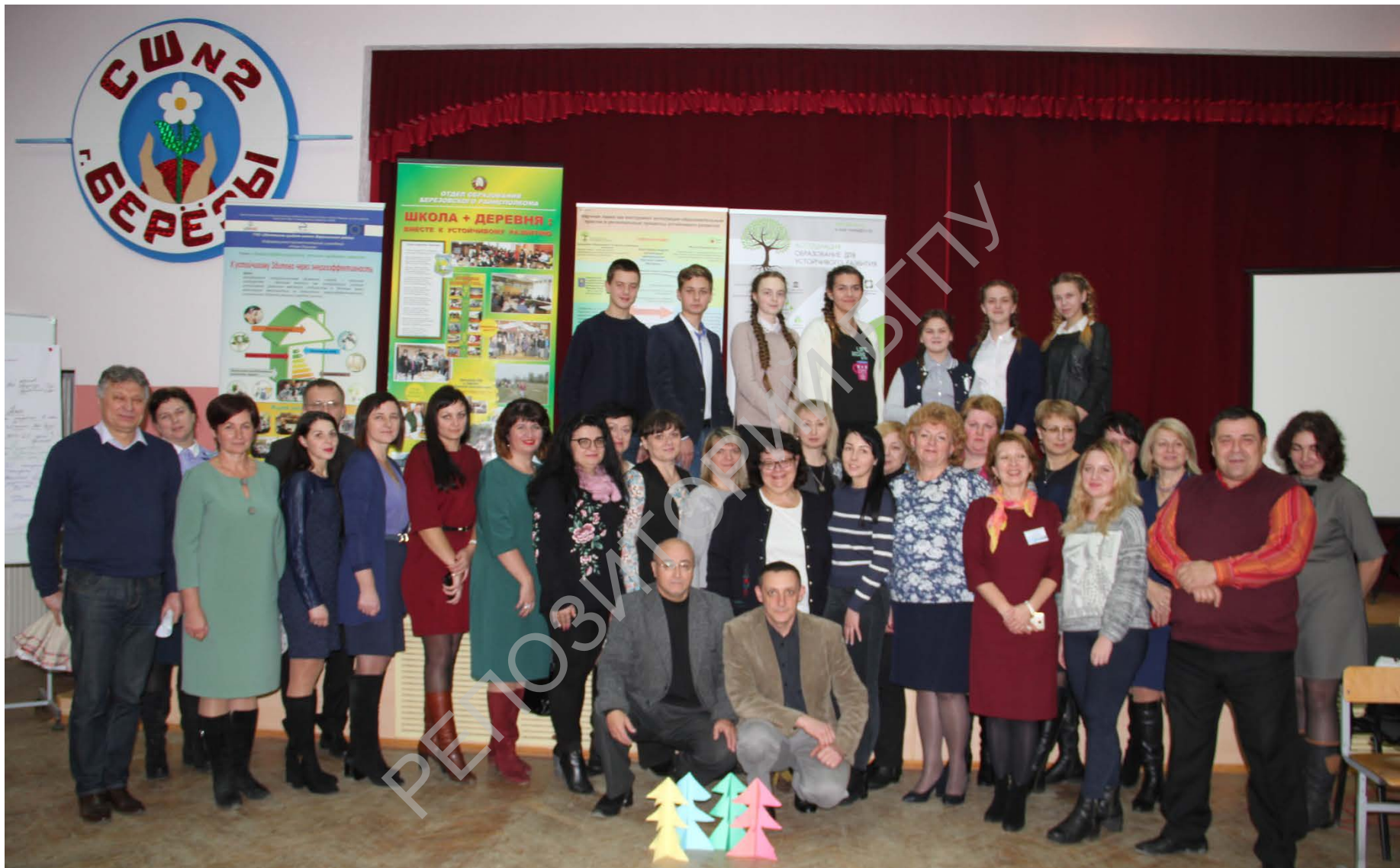
Талака «Образование для повышения качества жизни Березовского района»