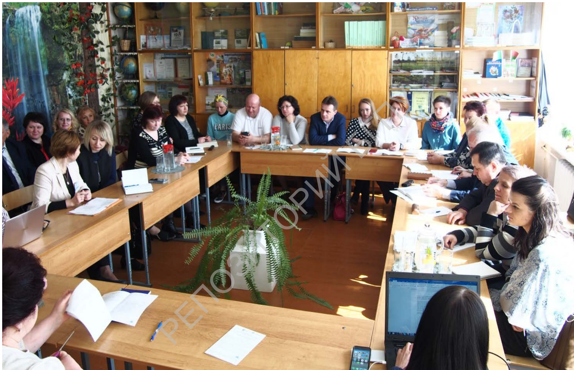
ОБРАЗОВАНИЕ - ведущий механизм устойчивого развития Практический семинар