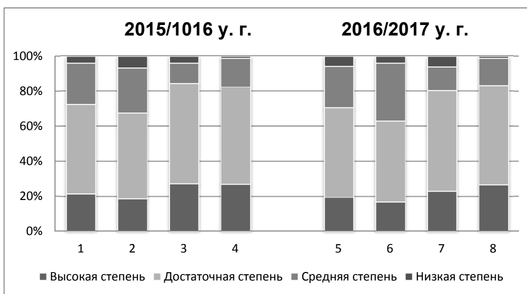
Рисунок 4 – Диаграмма степени адаптивности через 4 месяца после поступления в школу: 1 – Контрольные классы (Октябрь); 2 – Экспериментальные классы (Октябрь); 3 – Контрольные классы (Декабрь); 4 – Экспериментальные классы (Декабрь); 5 – Контрольные классы (Октябрь); 6 – Экспериментальные классы (Октябрь); 7 – Контрольные классы (Декабрь); 8 – Экспериментальные классы (Декабрь)

Следует отметить, что результаты исследований контрольных и экспериментальных групп на конец обучения в дошкольном учреждении по адаптивным способностям и результаты диагностического мониторинга по степени адаптации на момент поступления их в школу идентичны, подтверждая тем самым тот факт, что использование музыкальной среды при развитии коммуникативных способностей, формировании адекватной самооценки и благоприятный социальный статус ребенка в группе обеспечивает формирование устойчивого адаптационного потенциала.