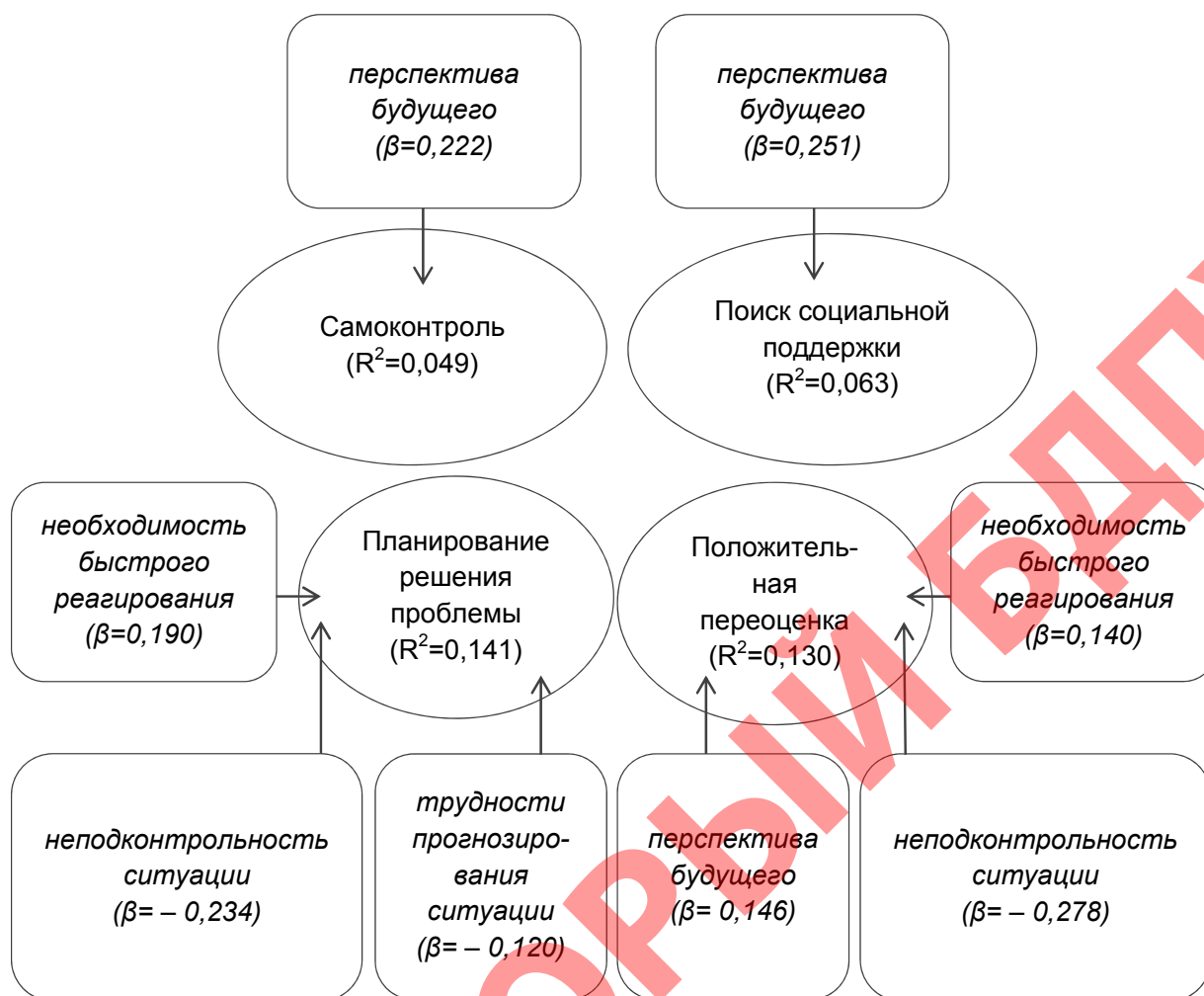
Рисунок 2. – Совокупное влияние факторов когнитивного оценивания на выбор копинг-поведения руководителей

На выбор копинг-стратегий «самоконтроль» ( R^2 = 0,049 ; F = 13,021 , p=0,00 ) и «поиск социальной поддержки» ( R^2 = 0,063 ; F = 17,006 , p = 0,00 ) оказывает влияние фактор «перспектива будущего». Соответственно, 4,9 % и 6,3 % вариаций рассматриваемых копинг-стратегий детерминированы воспринимаемой значимостью последствий ситуации. Как видно на рисунке 2, обозначенный фактор является положительным предиктором стратегий совладания «самоконтроль» ( \beta = 0,222 ; p = 0,000 ) и «поиск социальной поддержки» ( \beta = 0,251 ; p = 0,000 ). Иными словами, чем более значимо руководитель оценивает последствия ситуации, ее угрозу собственному благополучию, тем больше усилий он предпринимает для сдерживания эмоций, совершения недуманных поступков и тем активнее данный руководитель обращается за помощью и поддержкой к другим людям.