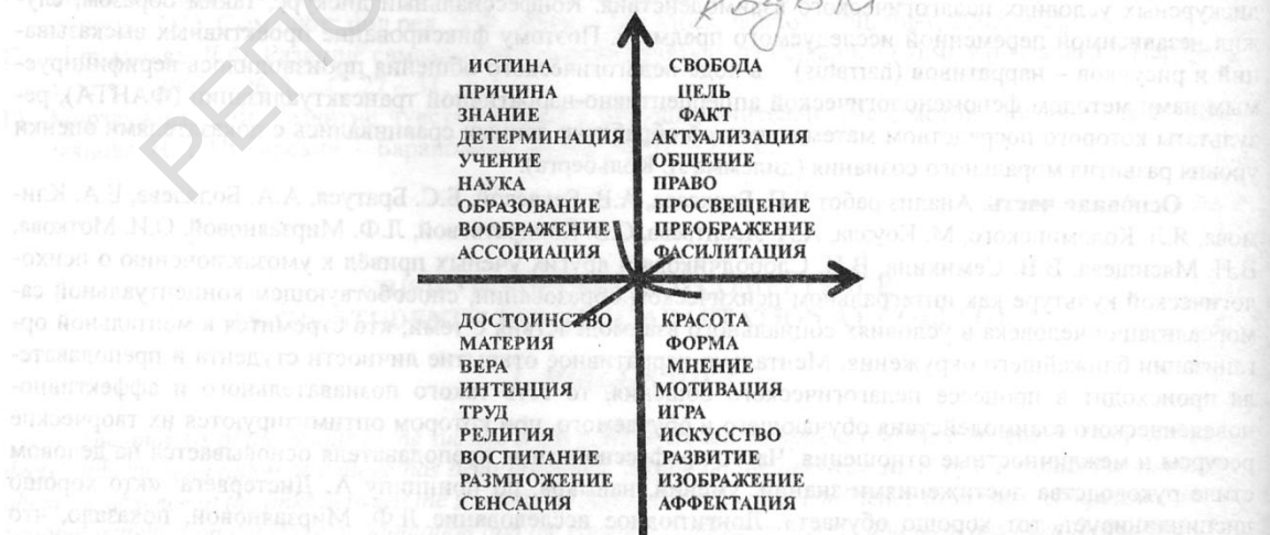
Рис. 1. Фрейм « \Psi -квинтэссенциал»