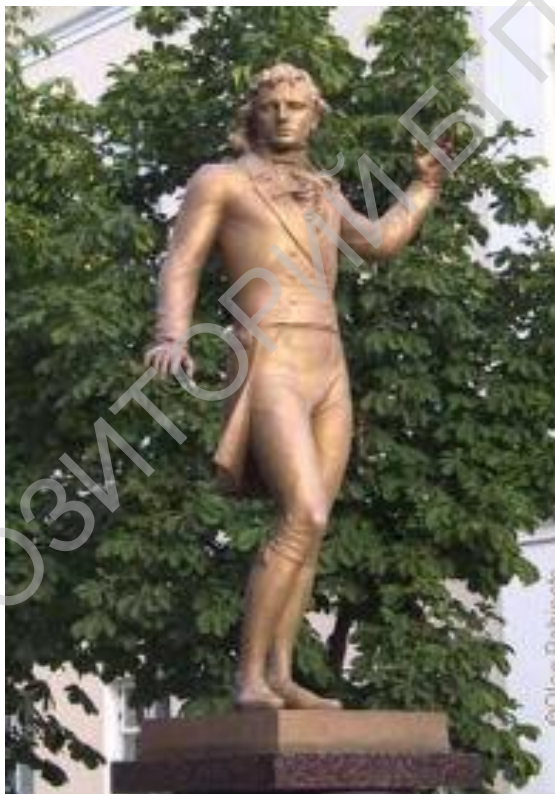
памятник в Беларуси

Полонез Огинского «Прощание с Родиной» прозвучал в двух советских фильмах. Первая картина, снятая в 1971 году, так и называется «Полонез Огинского». Вторая лента 1990 года «Попугай, говорящий на идиш». Полонез звучит в качестве музыкальной заставки в самом начале кинокартины.