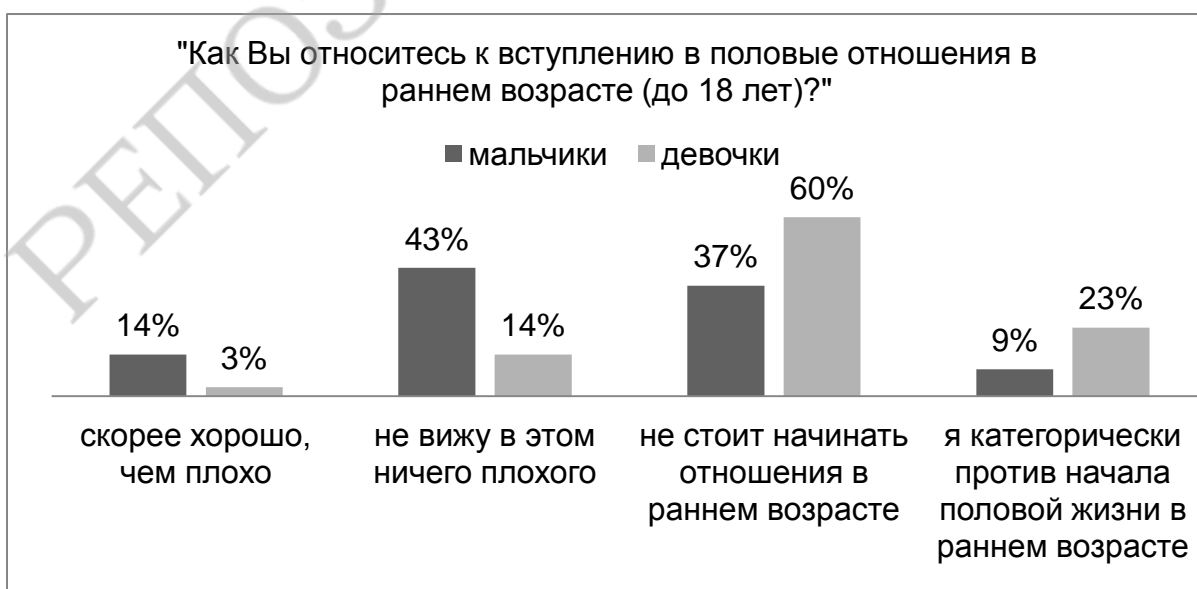
Рисунок 2. Отношение старшеклассников к вступлению в половые отношения в раннем возрасте (до 18 лет)

Выявлены гендерные различия в отношении к ранним половым связям учащихся. Мальчики в большей мере (57 %), нежели девочки (17 %), одобрительно относятся к ранним половым связям, а значит, не осознают рисков начала половых отношений в раннем возрасте (рис. 2).