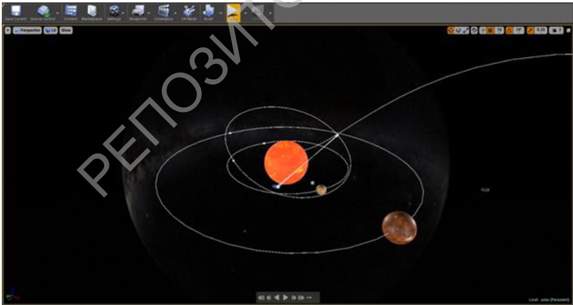
Рисунок 2 – Небесная сфера, небесные тела (Солнце, Меркурий, Венера, астероиды), эллипсоидные орбиты движения тел в среде разработки Unreal Engine

Анализ содержания учебных программ по физике и астрономии, а также современного состояния средств обучения показал, что средства разработки компьютерных игр можно использовать в целях создания образовательных проектов.