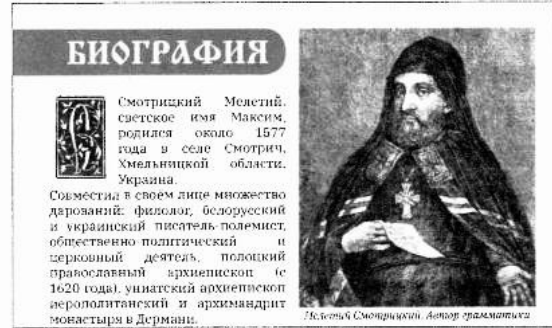
Рис. 4. Оформление заголовков. Буквица

• Третий раздел — «Грамматика» — раскрывает содержание главного филологического труда М. Смотрицкого, созданного им в 1618—1619 гг., выдержавшего множество переизданий, переработок и переводов. «Грамматика» состоит из четырёх частей: орфография, этимология, синтаксис, просодия. В качестве вступительных статей в неё были включены «Предисловие о пользе грамматики и философского учения» Максима Грека и «Слово о пользе грамотности» киевского учёного митрополита Петра Могилы. В конце книги помещены вопросы и ответы Максима Грека о грамматике, риторике и фи-