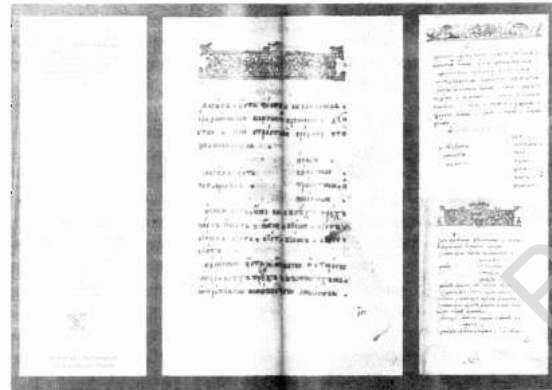
Рис. 5. Разворот издания с иллюстрациями