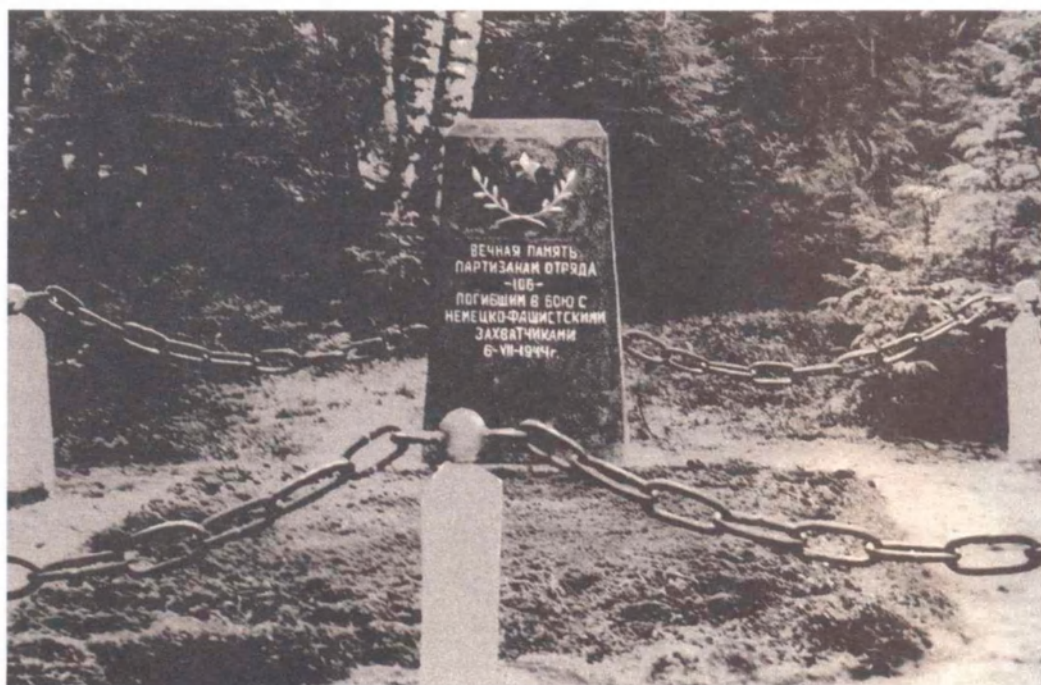
► Памятник погибшим партизанам отряда № 106. Налибокская пуща

Воины Вооруженных Сил Республики Беларусь свято чтут подвиги подпольщиков Минского гетто... Приказываю