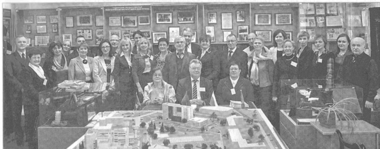
Участники конференции посетили музей истории Гродненского государственного университета имени Янки Купалы

Хозяева конференции, сотрудники Гродненского государственного университета имени Янки Купалы, познакомили гостей с системой работы вуза в области межкультурного образования, представили широкий спектр направлений воспитательной и учебной работы, содержание которой основано на принципах мультикультурности.