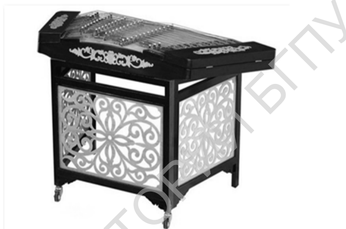
Рисунок 2 – Современный янцинь

Были выпущены две новые разновидности китайских цимбал: с тремя рядами подставок с десятью хорами струн и с четырьмя рядами подставок с двенадцатью (тринадцатью) хорами. Одна из последних моделей настраивалась по системе, аналогичной западной хроматической гамме. Для придания яркого звучания инструменту бронзовые струны, которые когда-то пришли на смену шелковым нитям, сменили на стальные.