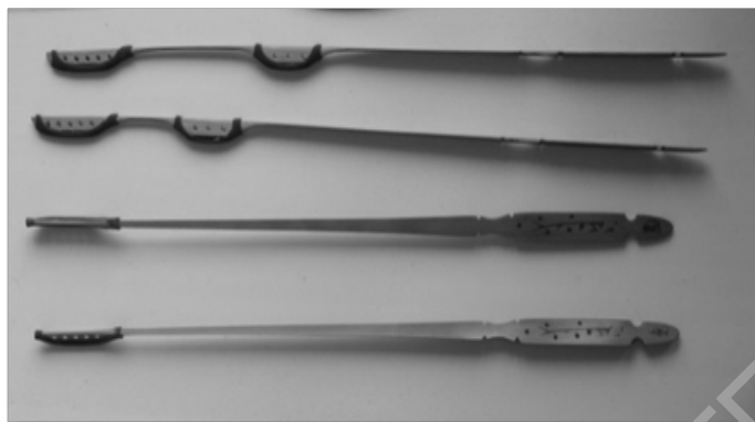
Рисунок 3 – Палочки

При производстве янция используется древесина твердых пород. Дека украшается резными узорами с национальной тематикой – драконами, цветами и т. д. Цимбалы устанавливаются на деревянную подставку, при изготовлении которой мастер вырезает сложные орнаменты, давая волю своей творческой фантазии. На двух передних ножках подставки встроены колесики, что значительно облегчает перемещение инструмента (Рисунок 2). Играют на янции с помощью двух 33-сантиметровых бамбуковых палочек с резиновыми наконечниками. Молоточки держат между большими и указательными пальцами рук. На одной палочке может иметься сразу два наконечника (рисунок 3), размещенных на таком расстоянии, чтобы при ударе ими по струнам звучали терция (в правой руке) или кварта (в левой руке). Таким образом, при одновременном ударе обеих рук музыкант может извлекать аккорды от двух до четырех звуков.