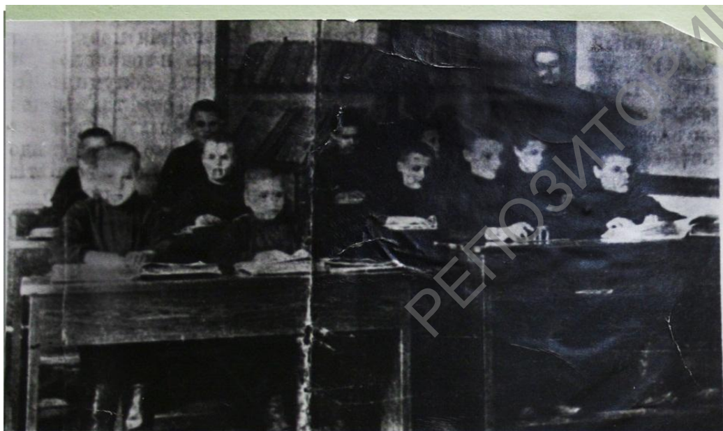
Ученики училища въ классѣ.

Летам 1929 г. Мінская школа сляпых у пошуках лепшых умоў для жыцця, вучобы і працы пераводзіцца на станцыю Чырвоны Бераг (паміж Жлобінам і Бабруйскам), а затым у г. Магілёў, дзе на яе базе ў 1933 г. была адчынена Ўсебеларуская школа для сляпых падлеткаў на 50 чалавек.