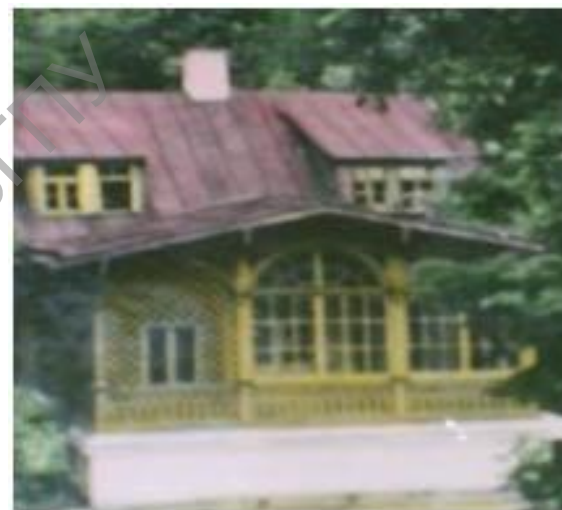
вул. Ажэшка, 24

У жніўні 1947 г. навучэнцаў перавялі ў горад Гродна па вул. Ажэшка, 24. Колькасць навучэнцаў павялічылася да 140 чалавек. Школа пераўтварылася ў васьмігадовую, а з 1955 г. - у сярэднюю. Для навучання працы былі адчынены трыкатажная, шчотачныя майстэрні. 30 музычна адораных дзяцей сталі навучацца ў гарадской музычнай школе.